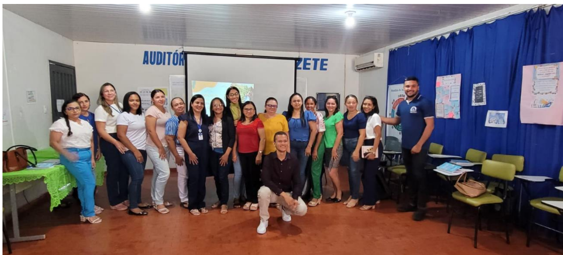
26/06/23 - Auditório da Secretaria Municipal de Educação