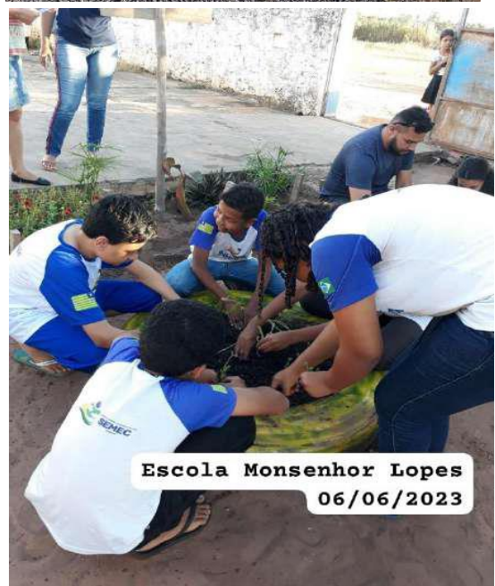
Escola Monsenhor Lopes 06/06/2023