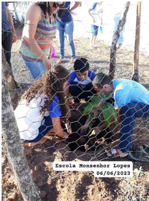
Escola Monsenhor Lopes 06/06/2023