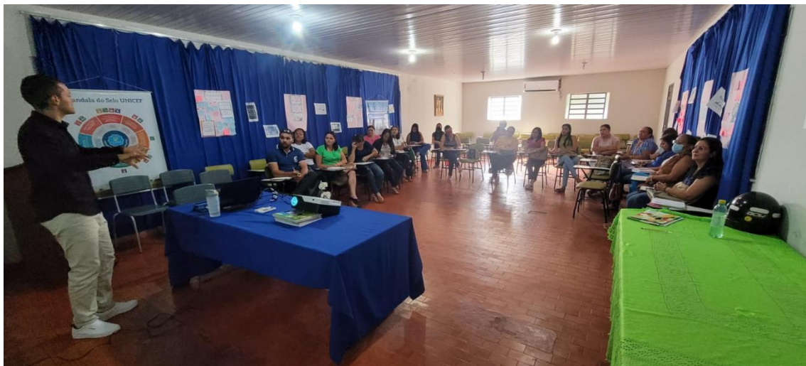
26/06/23 - Auditório da Secretaria Municipal de Educação