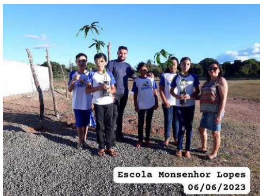
Escola Monsenhor Lopes 06/06/2023